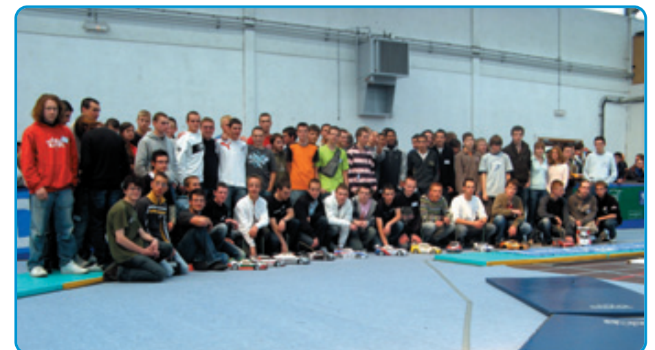
Toutes les équipes posent pour la photo avant le grand départ. ON sent un peu de fébrilité chez certains...