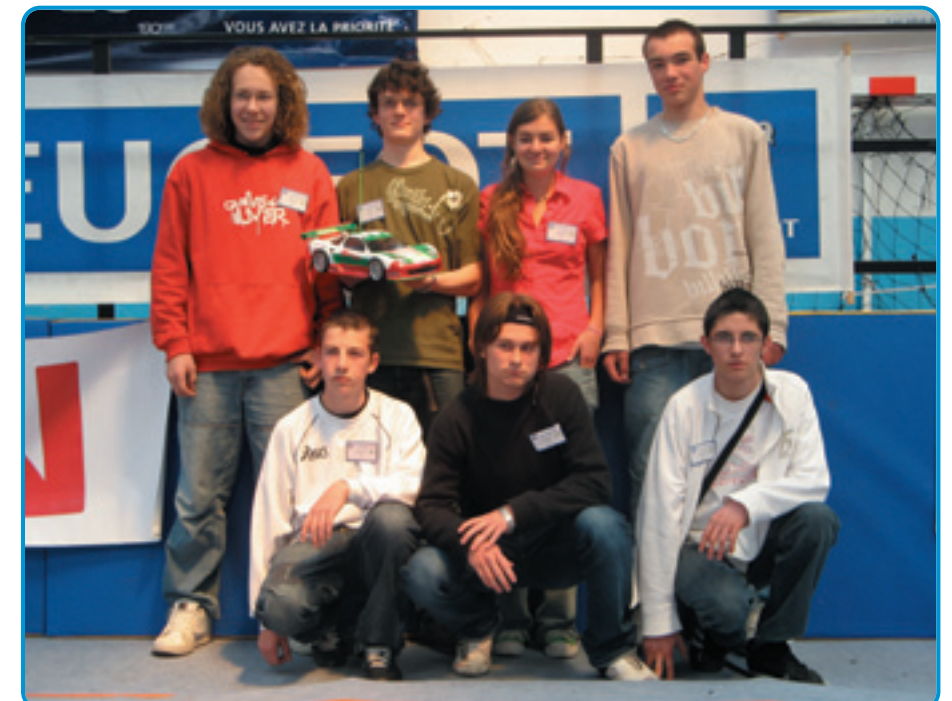
L'équipe victorieuse de cette première édition des 24 heures de Saint Jo. Ils peuvent être fiers car ils ont su réaliser une voiture performante et fiable. Le titre sera remis en jeu des l'année prochaine.