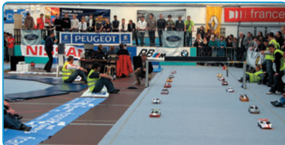
Quelques secondes avant le départ, la tension est palpable. D'ailleurs le manque d'expérience des pilotes et la présence de 14 voitures sur la grille ont engendré un mémorable carton à l'approche du premier virage !

Les 10 et 11 juin, les équipes se sont donc affrontées sur un circuit moquette dans le gymnase du lycée. Après la séance de qualification gérée par le comptage mis au point par les BTS de l'école, les équipes ont pris le départ pour un tour de cadran de pilotage et de mécanique. Finalement, les voitures ont fait preuve d'une fiabilité étonnante et je n'ai pas vu de pièces conçues sur place présenter la moindre faiblesse. Les petits soucis rencontrés ça et là provenaient le plus souvent des chapes plastiques qui cédaient sous les chocs ou de problèmes radios dus à des installations approximatifs et se réglaient en quelques minutes.