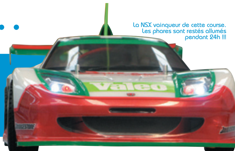
La NSX vainqueur de cette course. Les phares sont restés allumés pendant 24h !!!

Depuis 2 mois nous vous avons fait partager la préparation de ce fabuleux projet scolaire d'un lycée boulonnais : faire construire à des élèves des voitures radio commandées de A à Z et les engager à une course de 24 heures non stop !