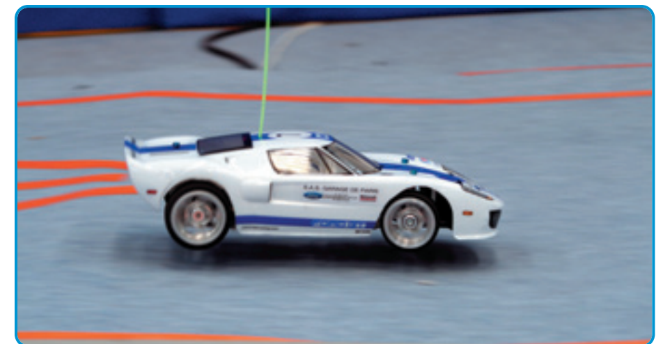
La boucle de comptage a été passée sous la piste ce qui a créé une petite surélévation qui faisait décoller les voitures à chaque tour. Heureusement que les châssis étaient du genre costauds... C'est pas tous les jours qu'on voit une Ford GT 40 décoller des 4 roues !