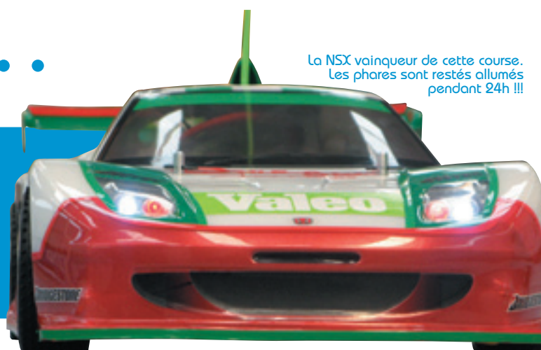
La NSX vainqueur de cette course. Les phares sont restés allumés pendant 24h !!!

Depuis 2 mois nous vous avons fait partager la préparation de ce fabuleux projet scolaire : faire construire à des élèves des voitures radio commandées de A à Z et les engager à une course de 24 heures non stop !