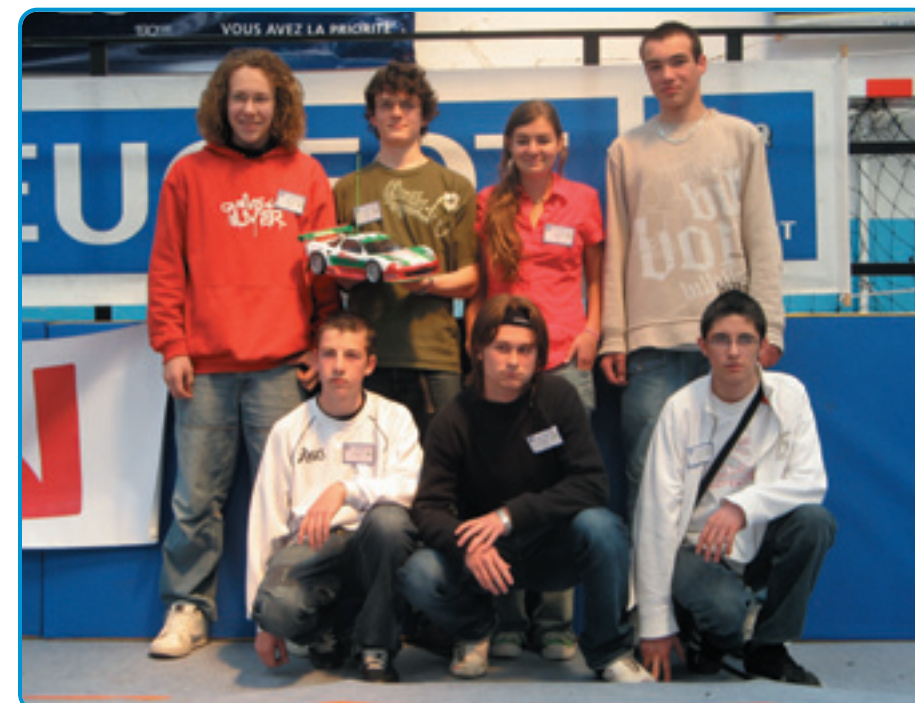
L'équipe victorieuse de cette première édition des 24 heures de Saint Jo. Ils peuvent être fiers car ils ont su réaliser une voiture performante et fiable. Le titre sera remis en jeu des l'année prochaine.

Le tracé est volontairement très simple pour s'adapter au nombre de voitures engagées et à l'inexpérience des pilotes. La plupart d'entre eux ne pratiquent pas la voiture RC en dehors de cette course !