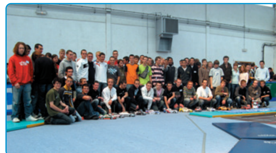
Toutes les équipes posent pour la photo avant le grand départ. ON sent un peu de fébrilité chez certains...