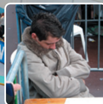
C'est long 24 heures...