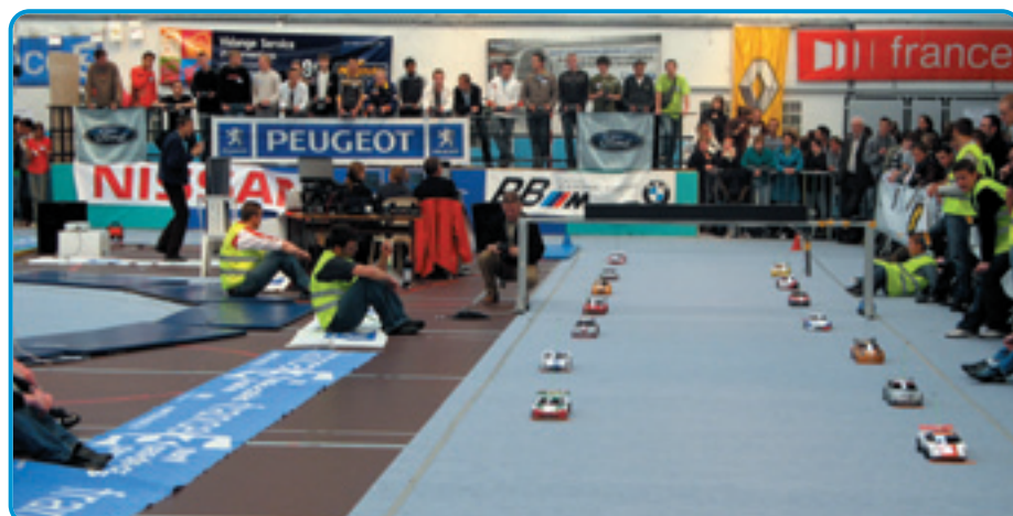
Quelques secondes avant le départ, la tension est palpable. D'ailleurs le manque d'expérience des pilotes et la présence de 14 voitures sur la grille ont engendré un mémorable carton à l'approche du premier virage !

Les 10 et 11 juin, les équipes se sont donc affrontées sur un circuit moquette dans le gymnase du lycée. Après la séance de qualification gérée par le comptage mis au point par les BTS de l'école, les équipes ont pris le départ pour un tour de cadran de pilotage et de mécanique. Finalement, les voitures ont fait preuve d'une fiabilité étonnante et je n'ai pas vu de pièces conçues sur place présenter la moindre faiblesse. Les petits soucis rencontrés ça et là provenaient le plus souvent des chapes plastiques qui cédaient sous les chocs ou de problèmes radios dus à des installations approximatrices et se réglaient en quelques minutes.